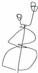
Azalealaan 107 · 2771 ZV Boskoop